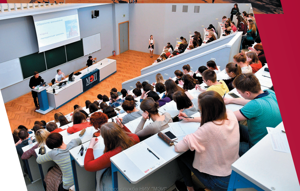
Пресс-служба НИУ "МЭИ"